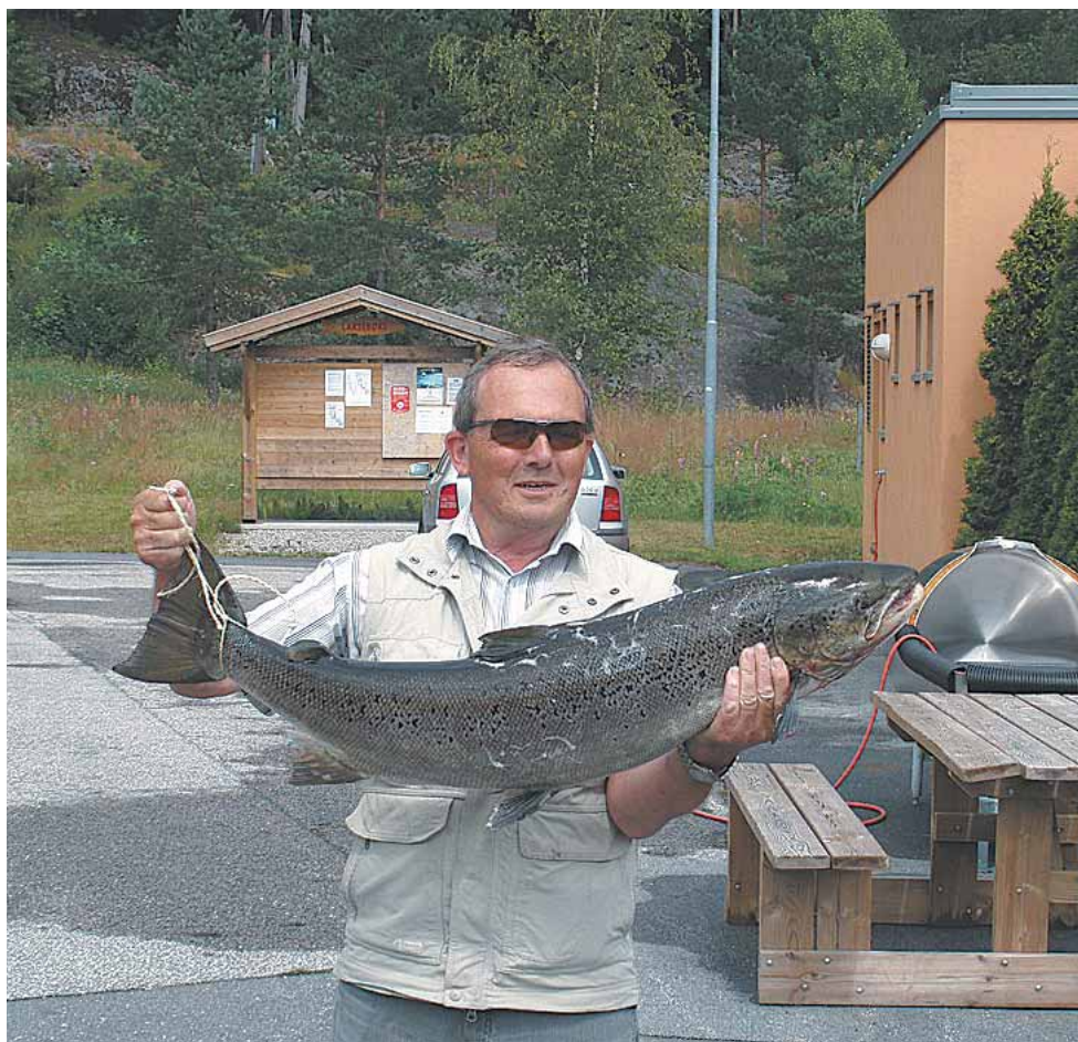
Laks fra Mandal.