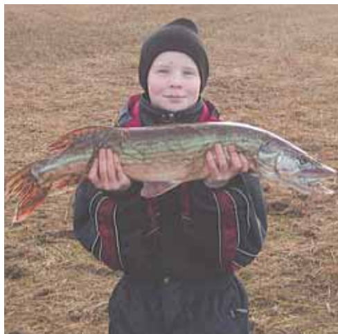
Her ses nogle af de unge mennesker med de flotte fangster.